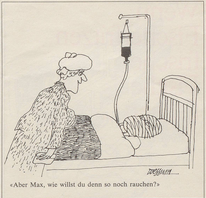
«Aber Max, wie willst du denn so noch rauchen?»

● Denk-Anstössiges Alternativpresse: das Samisdat der freien Marktwirtschaft. Peter Heisch