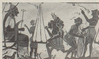
Wertvolle Pflanzen! König Arkiselaos von Kyrene (565 v. Chr.) beaufsichtigt das Wiegen von Heilkräutern (zeitgen. Darstellung).

Linderung und Heilung von Krankheiten aller Art suchten und fanden die Menschen seit jeher in den Kräften des Pflanzenreichs. Nach jahrhundertelanger Entwicklung präsentieren sich heute Extrakte aus Heilpflanzen als moderne und mildwirkende Arzneien, exakt in der Dosierung, gleichbleibend in der Qualität. Zeller bietet solche pflanzlichen Heilmittel gegen vielerlei Beschwerden.