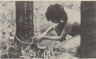
In Siam wird aus Einschnitten in der Stammrinde einer Styracaceae ein wichtiger Bestandteil des Zellerbalsam gewonnen.

Wenn Magen und Darm gegen reichliche und ungewohnte Kost mit Übelkeit, Krämpfen und Völlegefühl protestieren, dann bewährt sich Zellerbalsam .