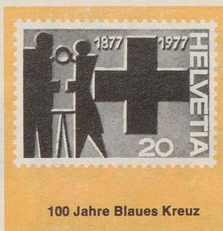
100 Jahre Blaues Kreuz