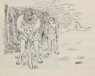
«Gib mir den andern Schläger!»