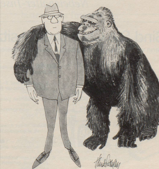
«Was sagst du, Buddy? Ich solle einen Drink holen für einen netten Artgenossen?»