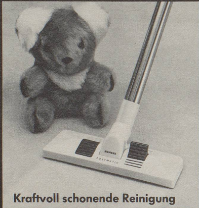
Kraftvoll schonende Reinigung