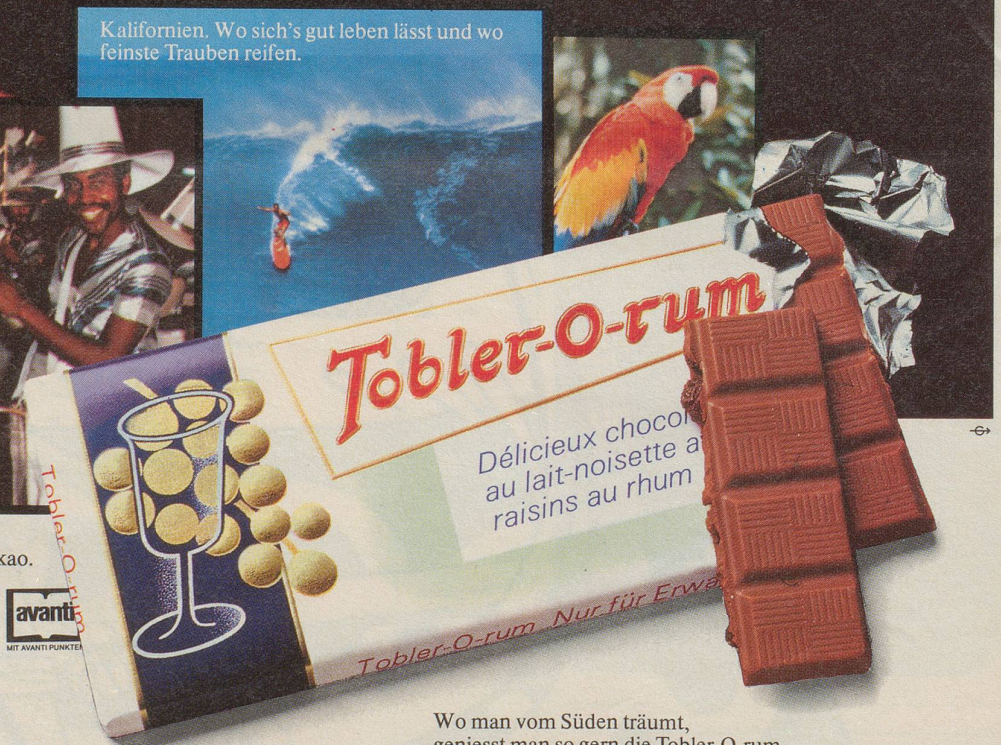
Wo man vom Süden träumt, genießt man so gern die Tobler-O-rum.

Die Trauben, der Rum und der Kakao. Gereift in der Sonne des Südens. Und mit Schweizer Alpenmilch vollendet nach exklusivem Tobler-Rezept.