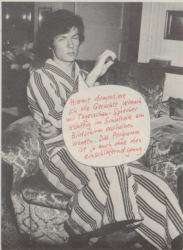
Tagesschausprecher Peter Richner

Hiermit dementiere ich alle Gerüchte, wonach wir Tagesschau-Sprecher künftig im Schlafrock am Bildschirm erscheinen werden. Das Programm ist ja auch ohne dies einschläfernd genug.