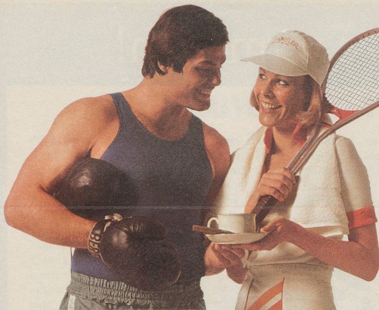
Das Schwergewicht lädt die Tennisspielerin zu einem Tässchen INCAROM ein.