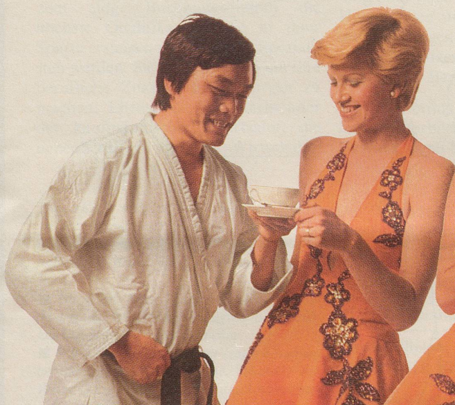
Der Karatemeister lädt die Tourniertänzerin zu einem Tässchen INCAROM ein.