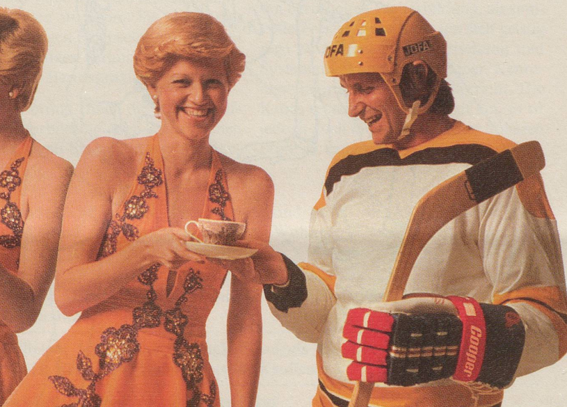
Die Tourniertänzerin lädt den Eishockeyspieler zu einem Tässchen INCAROM ein.