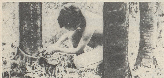
In Siam wird aus Einschnitten in die Stamrinde einer Styracaceae ein wichtiger Bestandteil des Zellerbalsam gewonnen.

Es stimmt nicht, dass die brandschatzenden und mordenden Terrorkommandos die Verantwortung für ihre Verbrechen übernehmen, wie sie es jeweils nach erfolgter Schandtat zynisch verkünden. Mord ist immer verantwortungslos. Schtächmugge