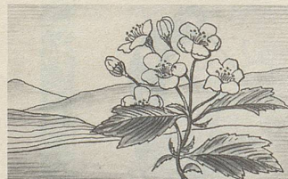
Crataegus, eine der Heilpflanzen, deren Extrakte in Zellers Herz- und Nerventropfen enthalten sind.

Zellerbalsam bewährt sich nun bereits seit über hundert Jahren. Er ist jetzt auch in Tablettenform erhältlich.