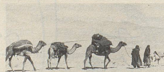
Auf „Wüstenschiffen“ werden Heilkräuter zum Hafen gebracht.

Qualität und nachweisbarer Wirksamkeit. Bei vielen Beschwerden helfen sie.