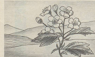
Crataegus, eine der Heilpflanzen, deren Extrakte in Zellers Herz- und Nerventropfen enthalten sind.

Zellerbalsam bewährt sich nun bereits seit über hundert Jahren. Er ist jetzt auch in Tablettenform erhältlich.