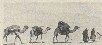
Auf „Wüstenschiffen“ werden Heilkräuter zum Hafen gebracht.

Qualität und nachweisbarer Wirksamkeit. Bei vielen Beschwerden helfen sie.