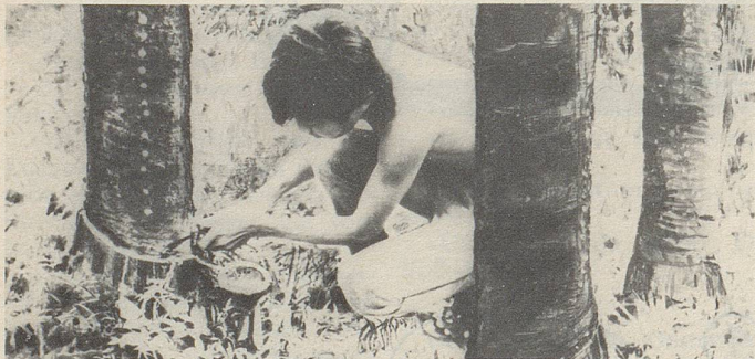
In Siam wird aus Einschnitten in die Stamrinde einer Styracaceae ein wichtiger Bestandteil des Zellerbalsam gewonnen.

Es stimmt nicht, dass die brandschatzenden und mordenden Terrorkommandos die Verantwortung für ihre Verbrechen übernehmen, wie sie es jeweils nach erfolgter Schandtat zynisch verkünden. Mord ist immer verantwortungslos. Schtächmugge