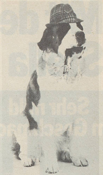
«Und mich fragt keiner?»

Im Quartier-Anzeiger für Unterstrass/Oberstrass entnahm ich den Antworten: «Ein Arzt sagte mir einmal, er würde jedem Rentner einen Hund verschreiben – wegen dem Auslauf und wegen der Einsamkeit.» Und: «Die Tiere sind in jeder Beziehung viel reinlicher und besser erzogen als die Menschen, die jeden Unrat auf Trottoirs und Strassen werfen.» Und: «In be-