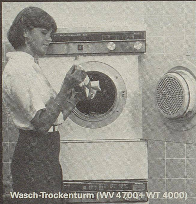
Wasch-Trockenturm (WV 4700+ WT 4000)