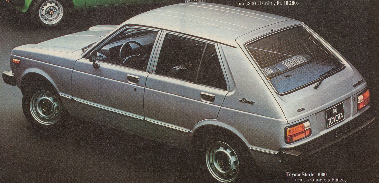
Toyota Starlet 1000 5 Türen, 5 Gänge, 5 Plätze, 4 Zylinder, 993 cm 3 , 47 DIN-PS bei 5800 U/min., Fr. 10 980.-