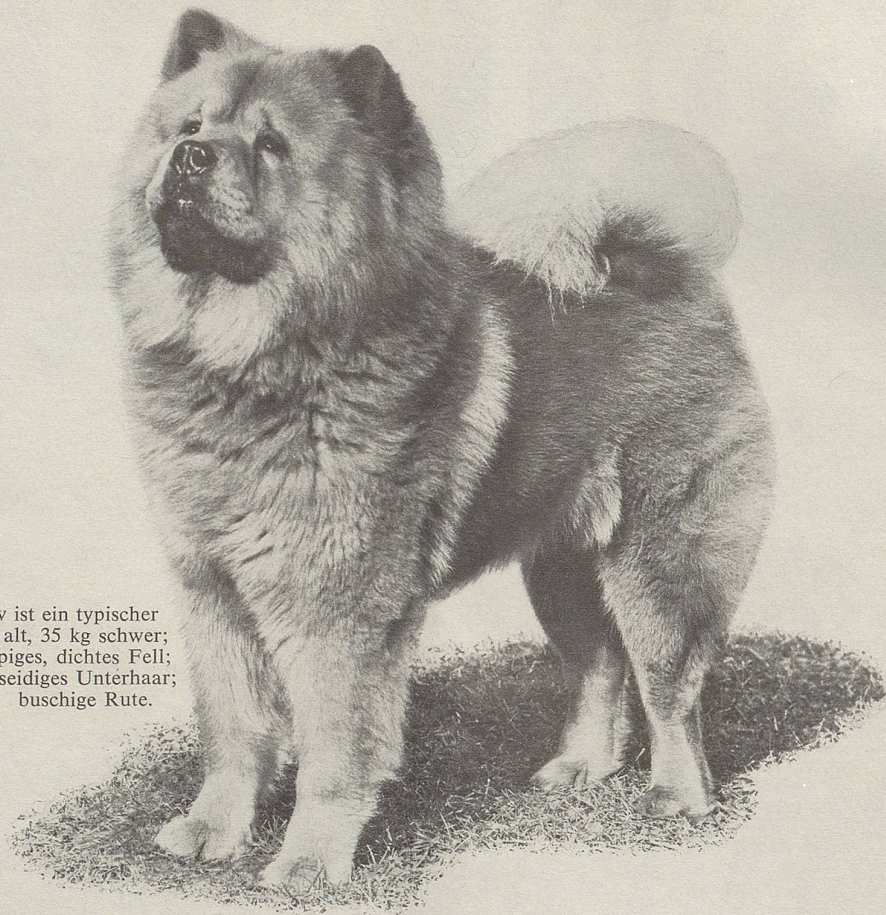
Dieser Chow Chow ist ein typischer Chappi-Hund: 3 Jahre alt, 35 kg schwer; üppiges, dichtes Fell; weiches, seidiges Unterhaar; buschige Rute.