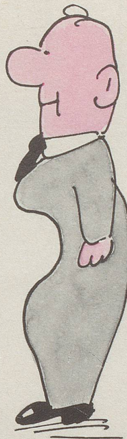
... aber kein Bauch auch nicht