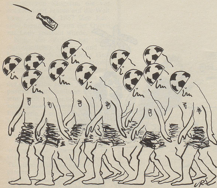
Die Fussballsaison in der BRD beginnt.

Was meinen Bekannten dazu geführt hat, eine solche Gewohnheit anzunehmen, weiss ich nicht, man kann mit ihm nicht darüber sprechen, im übrigen weiss ich auch nicht, wie es ihm zurzeit geht, denn im Moment, wo ich das schreibe, wird mir bewusst, dass ich ihn schon jahrelang nicht mehr besucht habe.