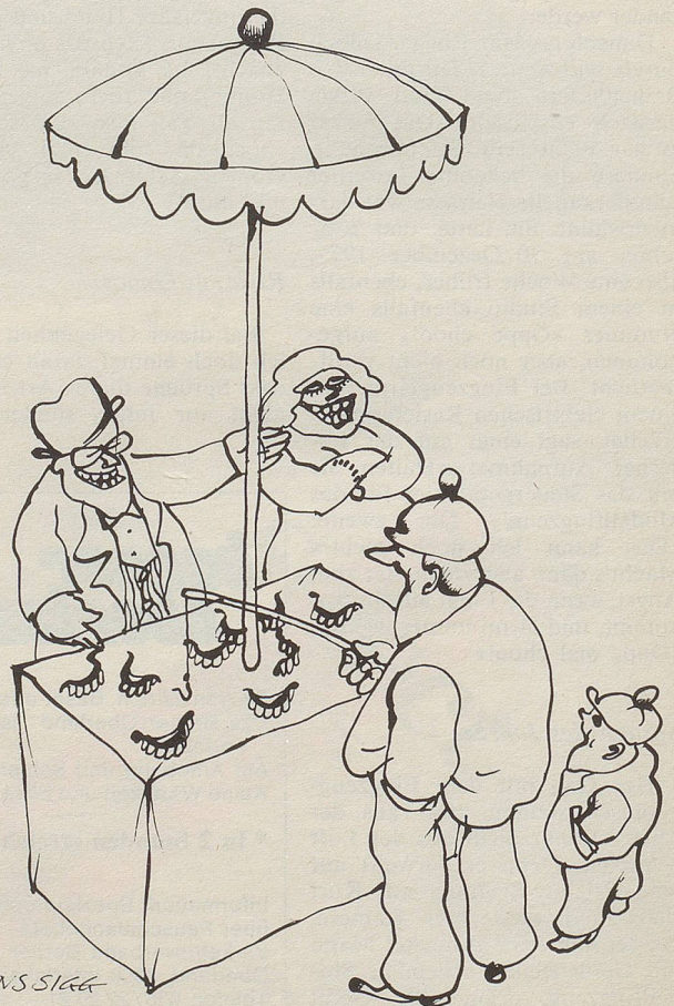
Zahnpflege: heute für jedermann erschwinglich.