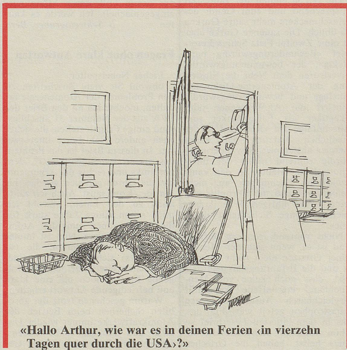
«Hallo Arthur, wie war es in deinen Ferien (in vierzehn Tagen quer durch die USA)?»

Wie Südtirol ist das Tessin ein behagliches Gebiet, wo sich der Norden und der Süden treffen, widersprechen und verbünden.