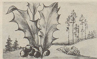
Ilex – eine der wirksamen Heilpflanzen in Zellers Herz- und Nerventropfen.

Wer kennt das nicht: Nervöse Spannungen, Unruhe, nervöse Reizbarkeit, Wetterfühligkeit, Lampenfieber vor Examen und wichtigen Besprechungen. Gegen diese Spannungszustände gibt es eine rein pflanzliche Arznei: