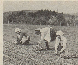
Ein Arzneipflanzenfeld wird geerntet.

Hier können Pflanzenkräfte helfen. Im Zellerbalsam sind die Säfte von