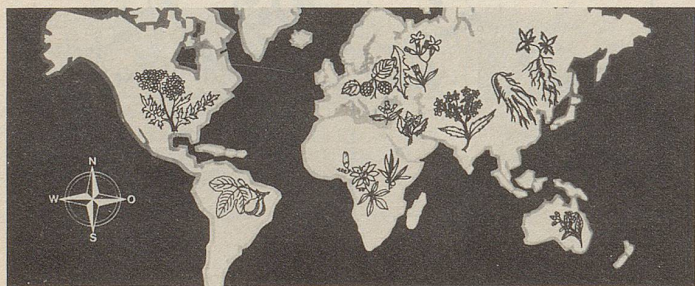
Pflanzen von allen Kontinenten in Zellers Heilmitteln.

Ohne weitere Zusammenhänge zu verfolgen, kann man schon jetzt feststellen, dass die gestiegenen Frauenpreise in Libyen zur Ankurbelung der kriselnden Weltwirtschaft beitragen, was zu begrüßen ist. Zumal alle anderen Massnahmen zur Verbesserung der Weltwirtschaftslage weit weniger versprechen.