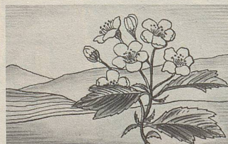
Crataegus, eine der Heilpflanzen, deren Extrakte in Zellers Herz- und Nerventropfen enthalten sind.

Zellerbalsam bewährt sich nun bereits seit über hundert Jahren. Er ist jetzt auch in Tablettenform erhältlich.