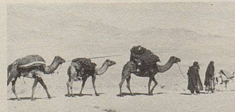
Auf „Wüstenschiffen“ werden Heilkräuter zum Hafen gebracht.

Qualität und nachweisbarer Wirksamkeit. Bei vielen Beschwerden helfen sie.