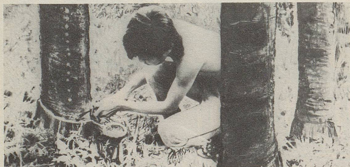
In Siam wird aus Einschnitten in die Stammrinde einer Styracaceae ein wichtiger Bestandteil des Zellerbalsam gewonnen.