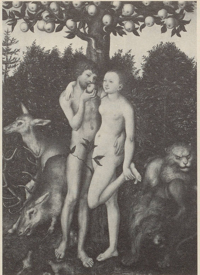
© by Cranach Hans (?), Adam und Eva (Sündenfall) um 1530/33, Linköping Länsmuseum