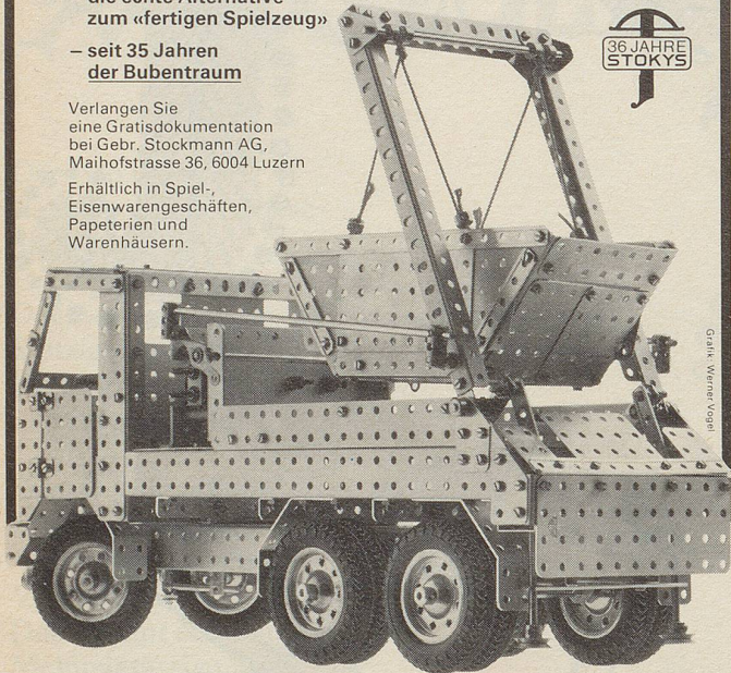
Grafik: Werner Vogel

Erhältlich in Spiel-, Eisenwarengeschäften, Papeterien und Warenhäusern.