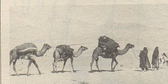
Auf „Wüstenschiffen“ werden Heilkräuter zum Hafen gebracht.

Qualität und nachweisbarer Wirksamkeit. Bei vielen Beschwerden helfen sie.