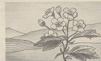
Crataegus, eine der Heilpflanzen, deren Extrakte in Zellers Herz- und Nerventropfen enthalten sind.

Zellerbalsam bewährt sich nun bereits seit über hundert Jahren. Er ist jetzt auch in Tablettenform erhältlich.