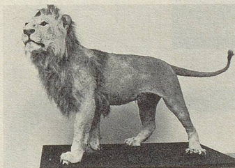
Eggenschwylers «Zürileuli» ausgestopft; es lebte von 1902 bis 1905 in Zürich.

ausgestopft noch immer vorhanden. Eggenschwyler betreute es daheim, meldete in der Zeitung, das Tier gehe «von einem Zimmer in das andere und horcht, auf welchem Bett der grosse Angora-Kater schläft, dann klettert er hinauf und der Kater verlässt fauchend sein Nest und das g'schide chline Leuli legt sich schnellstens exact in den weichen, warmen Trichter, den der schwarze Kater in die Bettdecke gedrückt hat. Ist das nicht ein richtiger Züribieter?» Später ging die Freude der Zürcher am Zürileuli zurück, weil Eggenschwyler mit dem mittlerweile ausgewachsenen, freilich zahmen Löwen durchs Niederdorf bummelte, das Tier an einer Leine führend. Der Polizeivorstand klemmte diese Promenaden ab, der Löwe durfte nur noch hinter Gittern gezeigt werden. Eggenschwyler dazu ungnädig: «Die Zürcher sind doch Furchthasen.»