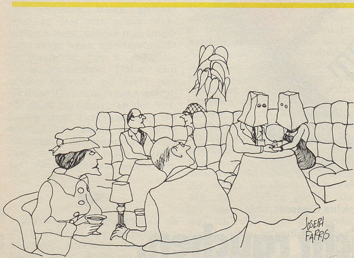
«Die beiden prüfen, ob sie geistig zusammenpassen!»