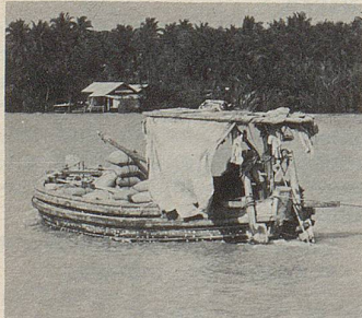
Transport von Heilpflanzen auf dem Menam (Thailand).

In Zellers pflanzlichen Arzneien stecken Kräfte der Natur. In wert-erhaltendem Verfahren und in immer