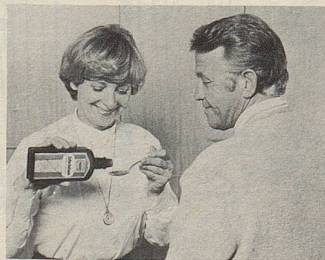
Zellerbalsam – seit über hundert Jahren das Hausmittel gegen Magen- und Darmbeschwerden.

Ein reines und bestens verträgliches Heilpflanzenpräparat sind auch Zellers Herz- und Nerven-Dragees . Selbst von Schwangeren können sie unbedenklich eingenommen werden, wenn die überreizten Nerven keine Ruhe finden und wenn sich erholsamer Schlaf nicht einstellen will. Weissdorn, Baldrian, Hopfen und die Passionsblume verlei-