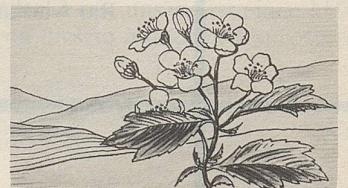
Fructus Crataegi, eine der Heilpflanzen, deren Extrakte in Zellers Herz- und Nerventropfen enthalten sind (nach Prof. Hörhammer).

hen diesen Dragees ihre besänftigende Wirkung, machen sie zu einer echten Schlafhilfe.