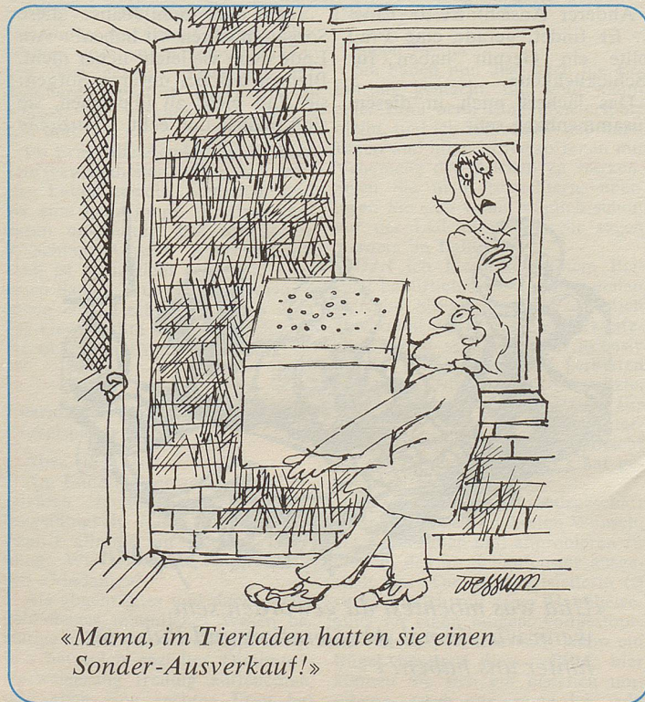
«Mama, im Tierladen hatten sie einen Sonder-Ausverkauf!»

«Ja, aber was? Noch länger auf der Schulbank herumhocken – nein! Was soll ich denn studieren? – Ich glaube, am ehesten Chirurgie oder so ..., jedenfalls etwas, das ins Handwerkliche geht. Ich muss einfach manuell etwas zu tun haben, wissen Sie, sonst werde ich verrückt.» UH