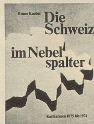
Bruno Knobel Die Schweiz im Nebelspalter Karikaturen 1875 bis 1974 2. Auflage 312 Seiten Fr. 49.—

Epigramme sind Sinngedichte. Als Instrument satirischer Zeitkritik demaskieren diese Epigramme, was dem Autor auf dem weiten Feld menschlicher Unzulänglichkeit begegnet.