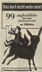
Felix Rorschacher Das darf nicht wahr sein! 99 ungläubliche aber wahre Druckfehler und Stillblüten 90 Seiten Fr. 9.80

Diese imaginär-frechen Notizen eines Schweizer Buben brauchen keine weitere Empfehlung. Sie waren und sind immer wieder ein besonderes Lesevergnügen.