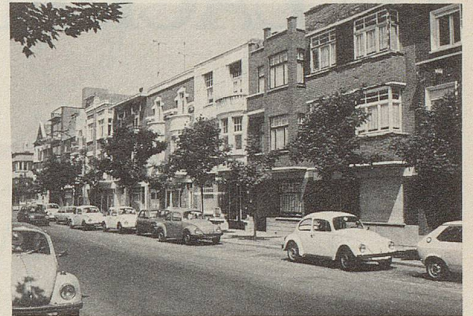
... steht in starkem Kontrast zum alten Kern des Städtchens.