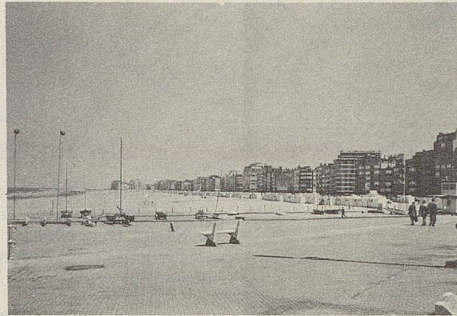
Der lange Strand von Knokke ...

Das alles also in Knokke-Heist, einem seit langem berühmten und mondänen Badeort an der Nordsee mit rund 27 000 Einwohnern, die sich während der Saison um einige tausend vermehren. Es soll das teuerste Seebad der dortigen Küste sein, was man als Besucher