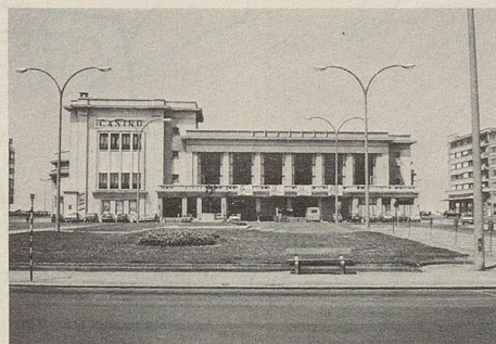
Das Casino. Im Inneren Wandbilder des Surrealisten René Magritte.