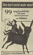
Felix Rorschacher Das darf nicht wahr sein 99 ungläubliche aber wahre Druckfehler und Stillblüten 90 Seiten Fr. 9.80

Diese imaginär-frechen Notizen eines Schweizer Buben brauchen keine weitere Empfehlung. Sie waren und sind immer wieder ein besonderes Lesevergnügen.