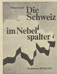
Bruno Knobel Die Schweiz im Nebelspalter Karikaturen 1875 bis 1974 2. Auflage 312 Seiten Fr. 49.—

Epigramme sind Singgedichte. Als Instrument satirischer Zeitkritik demaskieren diese Epigramme, was dem Autor auf dem weiten Feld menschlicher Unzulänglichkeit begegnet.