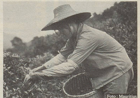
Aus dem Fernen Osten werden viele Heilkräuter importiert.