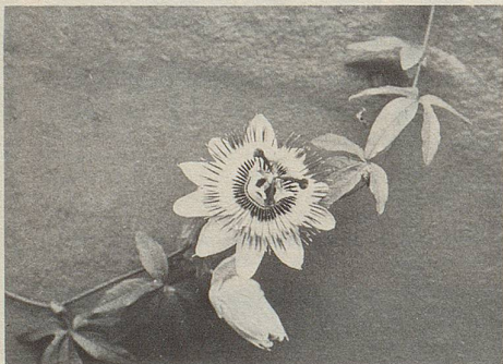
Zu den Kräutern, denen Zeller-Tropfen ihre beruhigende Wirkung verdanken, gehört auch die Passiflora (Passionsblume).