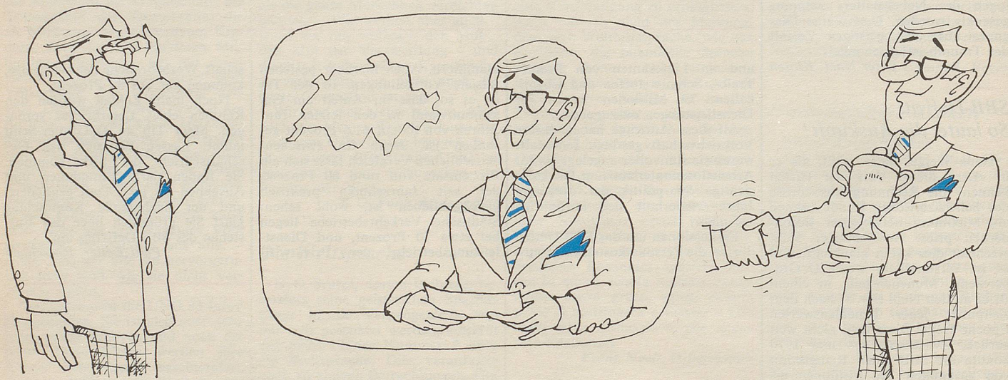
Tagesschau-Sprecher Emil Wanzenried wurde zum «bestangezogenen Mann» des Jahres erkoren.