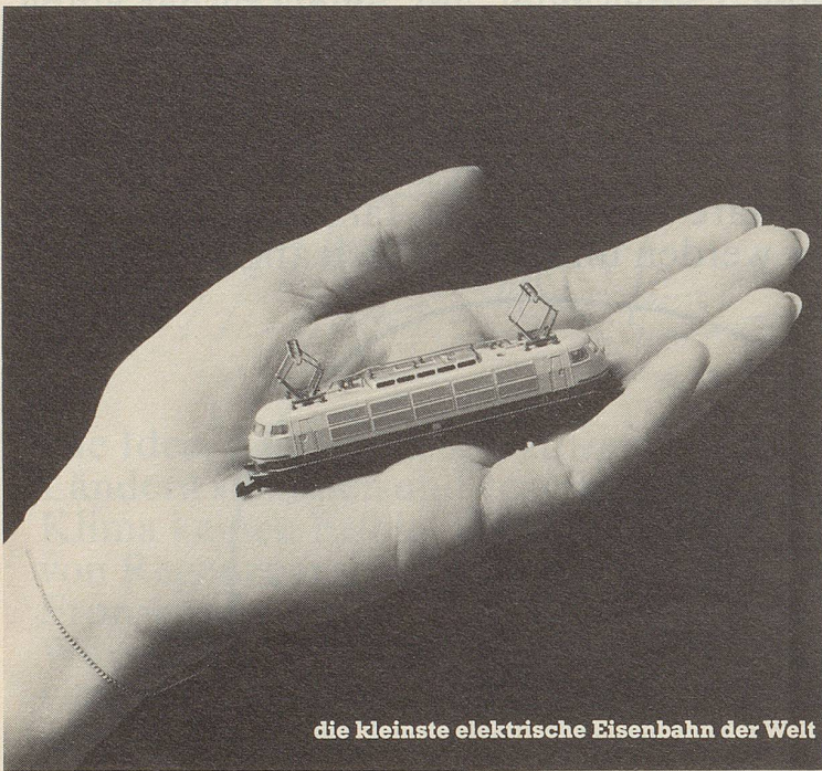
die kleinste elektrische Eisenbahn der Welt

Bei der kleinsten elektrischen Eisenbahn der Welt, der Märklin mini-club, kommen Männer ins Schwärmen. Faszinierend klein und doch eine ausgereifte, vollwertige Modellbahn. Bis ins kleinste Detail. Bis zur echten Oberleitungsfunktion.