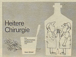
Hans Moser Heitere Chirurgie Ein fröhliches medizinisches Bilderbuch 80 Seiten Fr. 9.80

Eine Autofibel für Automobilisten, besonders auch den Antiautomobilisten zur Lektüre empfohlen. In Zeichnung und Text verspottet Moser die menschlichen und allzu menschlichen Eigenheiten des Menschen auf den vier Rädern, die die Welt bedeuten. Ein Spass!