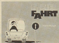
Hans Moser Freie Fahrt Humorbuch für Strassenbenützer 72 Seiten Fr. 12.80

Er hat recht, sein Spott am Sport ist nicht tödlich, nicht diffamierend und reisst nicht im geringsten am Tun und an der Bewegung, die nun einmal im Sport Mittelpunkt sind. Diese Sportkarikaturen zum Vergnügen und zur Entspannung aller geschaffen, die ein bisschen wider den tierischen Ernst lücken, der dem Sport fälschlicherweise unterlegt wird.