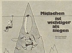
Hans Moser Mittlachen ist wichtiger als siegen Sportkarikaturen 96 Seiten Fr. 9.80

Dieses Büchlein will Ferienstimmung schaffen, um Ferien in Stimmung zu verbringen. Das erst vermittelt Entspannung, Erholung, Feriengenuss. Darum freut euch des Lebens! (sonst ist vieles vergebens).