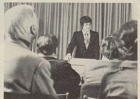
Momente höchster nervlicher Spannung: Der erste Vortrag. Da bewähren sich Zeller Entspannungs-Dragees