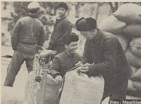
Versteigerung heilkräftiger Kräuter auf einem orientalischen Markt