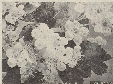
Auszüge aus Blüten und Blättern des Weissdorn geben Zeller Herz- und Nerventropfen ihre Heilkraft