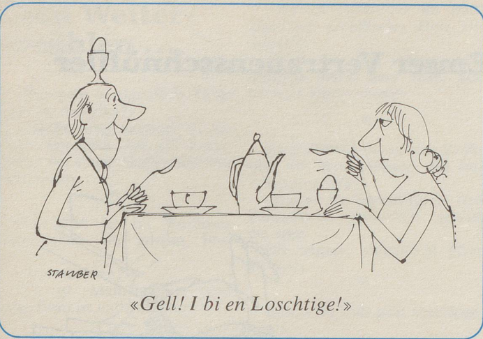
«Gell! I bi en Loschtige!»