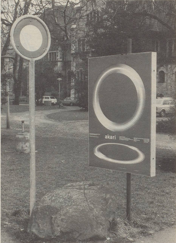
Verkehrszeichen sollen, so fordert der Heimatschutz, wenn immer möglich auf die Umgebung abgestimmt werden. Hier ist das in optimaler Weise gelungen.