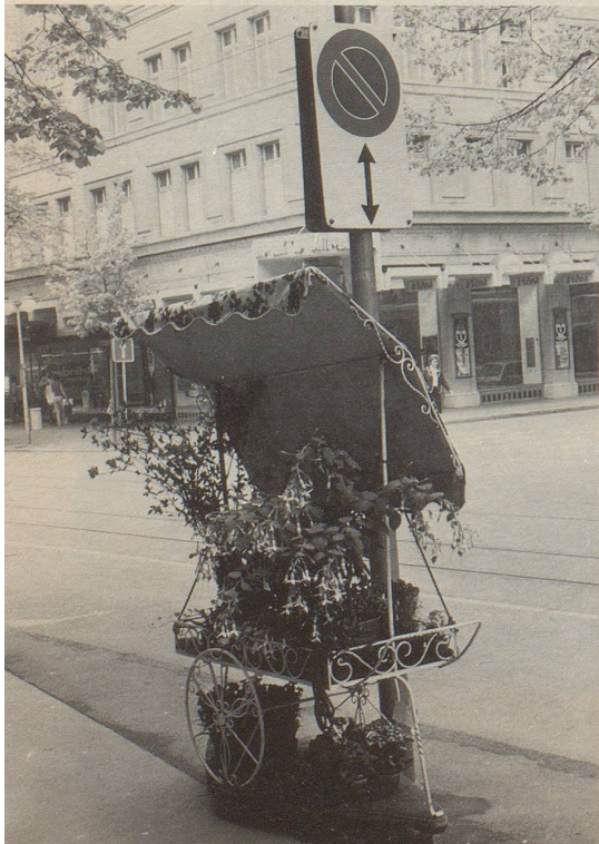
Hier vermissen wir den wichtigen Hinweis: «Ausser für Blumen-Cabriolets.»