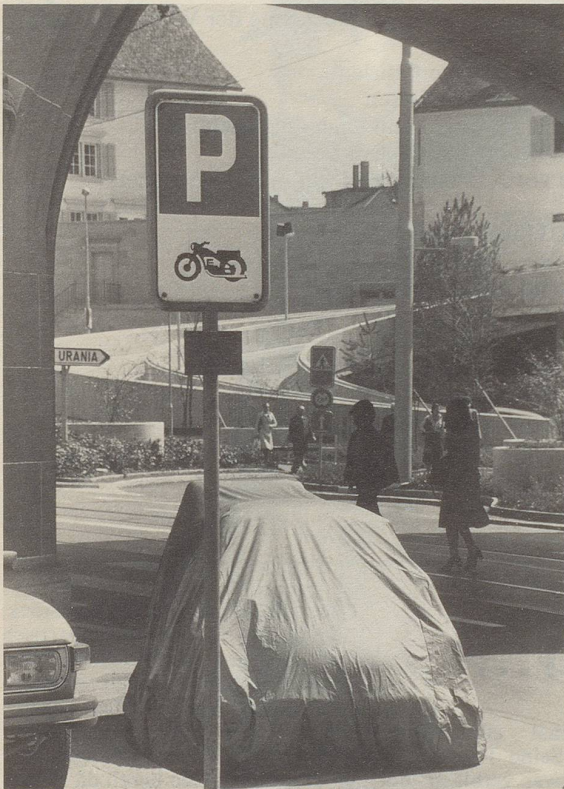
Dieser Automobilist hat ein klares Verkehrsschild clever umschifft, indem er sein Mini-Auto als Töff tarnte.