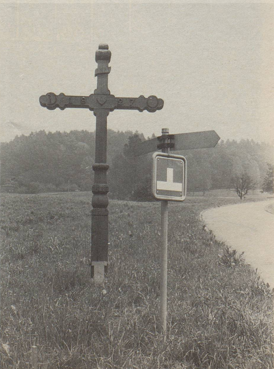
Kirche in der Sackgasse? Eine etwas gewagte Anordnung.