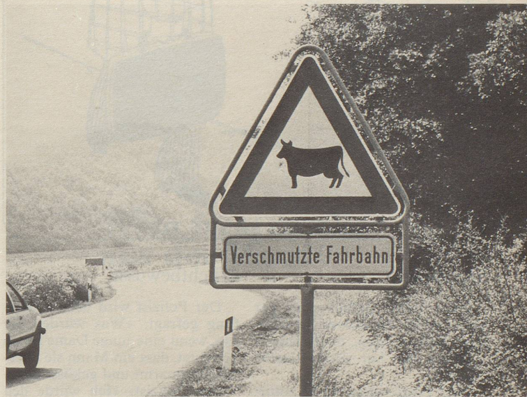
Ein ganz neuer Trend: die Kühe vor den Abgasen zu warnen!