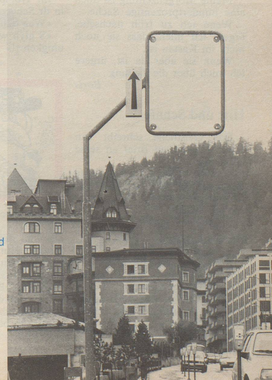
Neu im Strassenbild: das Leer-Signal. Es wird aufgestellt, wo an sich kein Verkehrsschild nötig wäre, eine Bereicherung des Ortsbildes jedoch erwünscht ist.