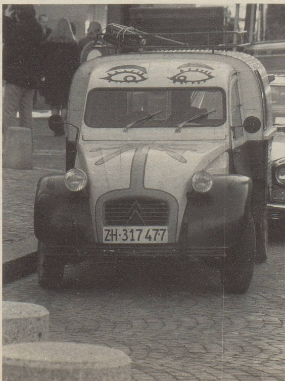
Nur mit offenen Augen ist der heutige Automobilist den Anforderungen des Zeichen-Dschungels gewachsen.