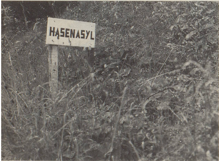
Mehr und mehr wird auch unser Wald durch Zeichen und Markierungen aller Art bereichert. Weil Hasen eher kurzsichtig sind, wurde hier ein grösserer Schrifttyp gewählt.