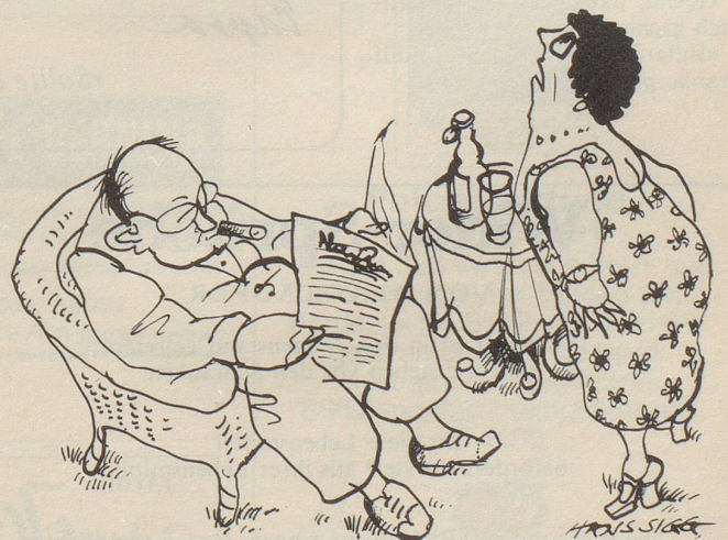
«Reg dich doch nicht so auf – doch wieder falscher Alarm!»