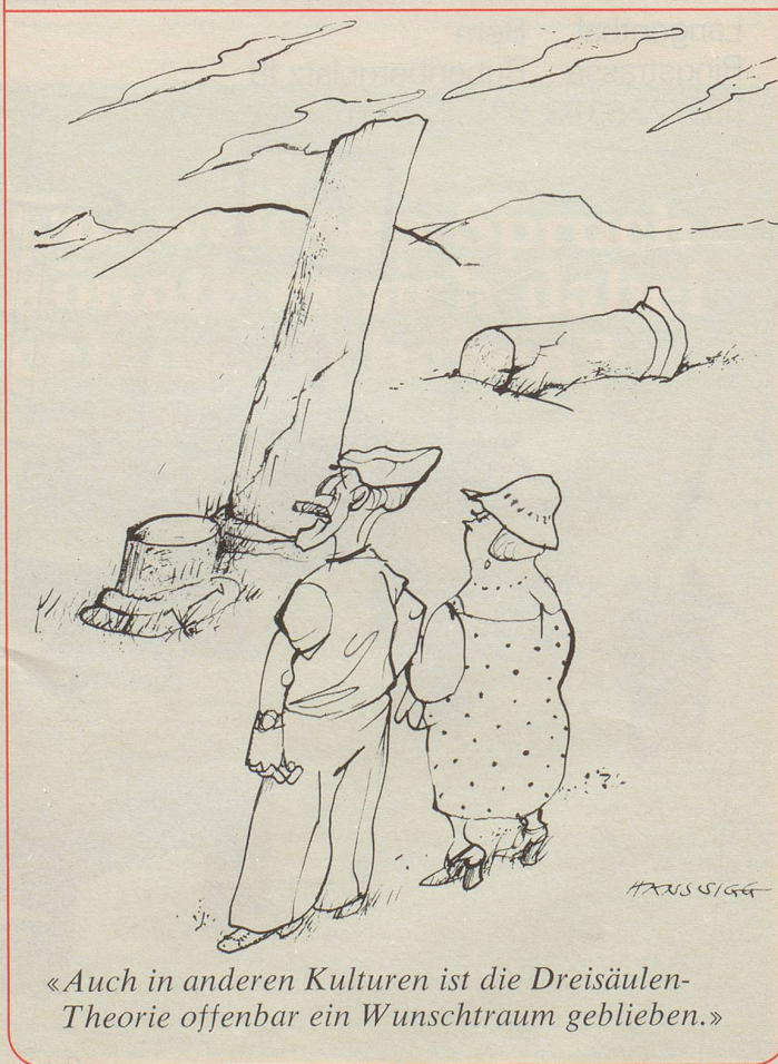
«Auch in anderen Kulturen ist die Dreisäulen-Theorie offenbar ein Wunschtraum geblieben.»