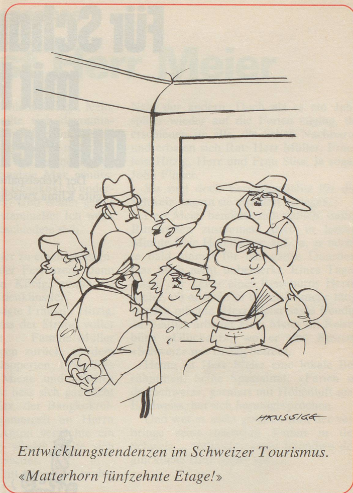
Entwicklungstendenzen im Schweizer Tourismus. «Matterhorn fünfzehnte Etage!»

«Ich suche», heisst es in einem Schreiben ans Zürcher Verkehrsbüro, «ein Ferienzimmer in der Umgebung von Zürich, etwa Lenzerheide oder Gstaad.» Geographie ist überhaupt ein Fall für