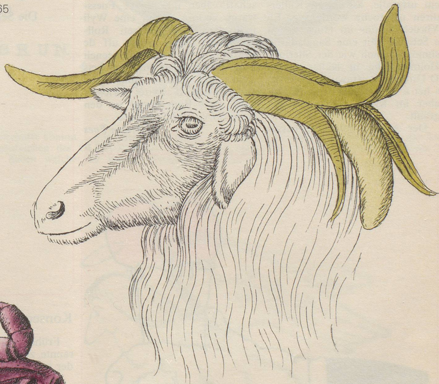
Antonio Pisanello Kopf des Widders