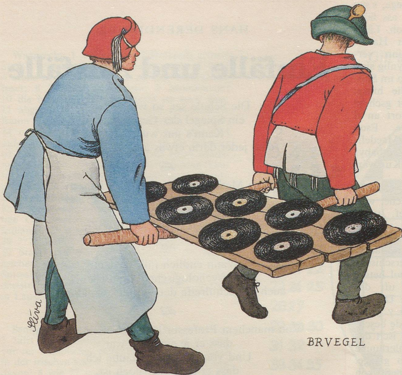
Pieter Bruegel Bauernhochzeit (Ausschnitt), 1565

Den wahren Kunstkenner erkennt man daran, dass er bei Aktbildern Höchstpreise für die Adresse des Modells zahlt.