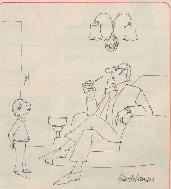
«Gewiss, Grossvater war in seiner Jugend ein «irrer Gei», aber Gott bewahre nicht in dem Sinn, wie du das verstehst!»