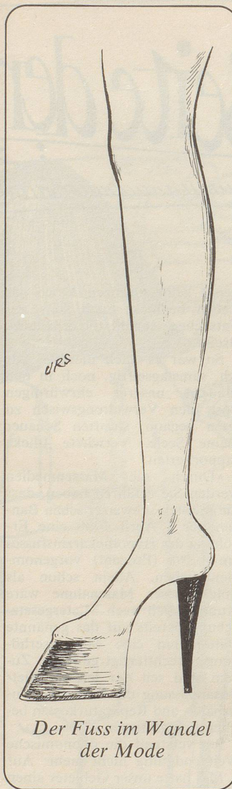
Der Fuss im Wandel der Mode

Eine «Händlerader» musste man in seinem Körper fühlen, wollte man sich hinter die Körbe und Säcke stellen. Meine Schwester und ich waren «neumodisch» gekleidet, trugen aber eine leinene Trachtenschürze. Ein Gastwirt fragte uns: «Wo kommen denn die schönen Landjunkerinnen her?» Als wir ihm Auskunft erteilt hatten, kaufte er uns zwei Säcke Kartoffeln ab, die wir ihm später vor die Wirtschaft führen mussten. (Damals war es nicht so schwierig wie heute, mit Pferd und Wagen durch Zürich zu kutschieren, nur auf die Tramschienen musste man aufpassen.) Bald kamen Stadtfrauen in Begleitung ihrer Köchinnen auf den Markt, um ihre Einkäufe zu tä-