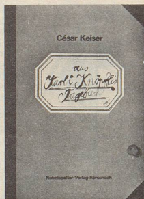
César Keiser Aus Karli Knöpfli's Tagebuch 48 Seiten Fr. 9.80