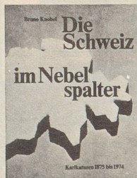
Bruno Knobel Die Schweiz im Nebelspalter Karikaturen 1875 bis 1974 2. Auflage 312 Seiten Fr. 49.—

Epigramme sind Sinngedichte. Als Instrument satirischer Zeitkritik demaskieren diese Epigramme, was dem Autor auf dem weiten Feld menschlicher Unzulänglichkeit begegnet.