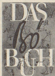
Eduard Stäubli Das Bö-Buch 224 Seiten Fr. 25.—

Entrückte und vergessene Episoden schweizerischer Geschichte der letzten hundert Jahre werden lebendige Gegenwart durch die Karikatur und die Hinweise.