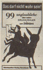
Felix Rorschacher Das darf nicht wahr sein! 99 unglaubliche aber wahre Druckfehler und Stilblüten 90 Seiten Fr. 9.80

Diese imaginär-frechen Notizen eines Schweizer Buben brauchen keine weitere Empfehlung. Sie waren und sind immer wieder ein besonderes Lesevergnügen.