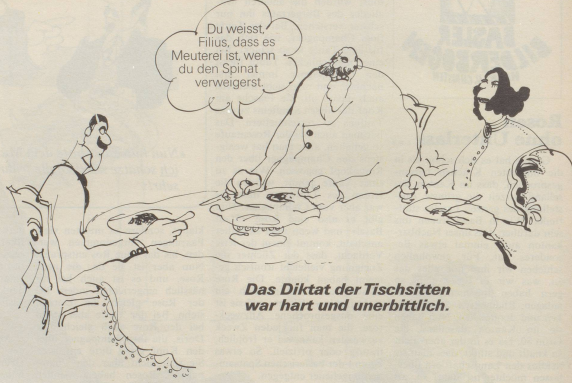
Das Diktat der Tischsitten war hart und unerbittlich.