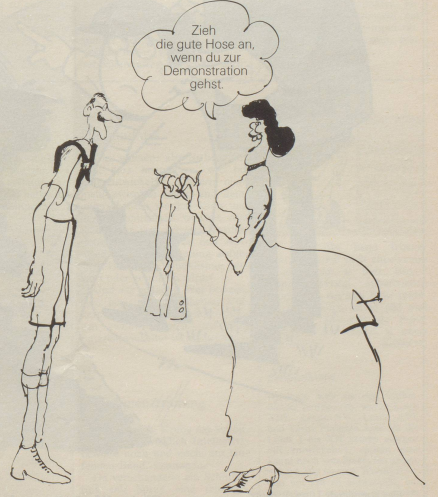
In der Öffentlichkeit hatte man sich stets schicklich gekleidet zu zeigen.