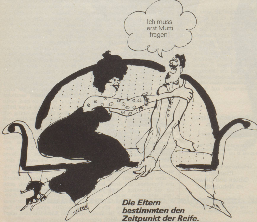
Die Eltern bestimmten den Zeitpunkt der Reife.