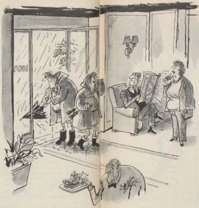
«Toll! Tennisplatzbenützung ist in der Pauschale inbegriffen!»