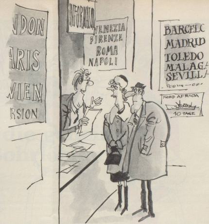
«Die nächsten 3 Frühstücke, 2 Mittag- und 3 Abendessen müssen wegen des Streiks des Servierpersonals ausfallen – wir empfehlen Ihnen einen unserer preisgünstigen 5-Tage-Ausflüge!»