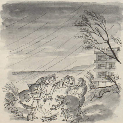
«Klar, dass sie in diesem milden mediterranen Klima keine Hotel-Heizung brauchen!»