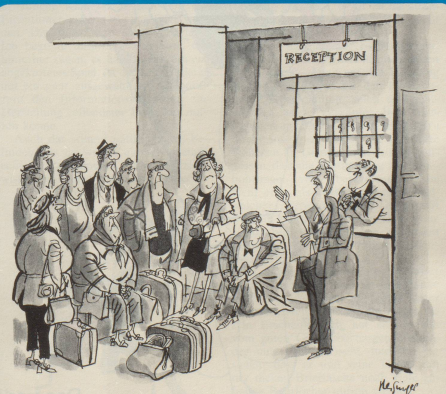
«Natürlich ist es bedauerlich, dass wir voll besetzt sind; aber ich kann Ihnen die erfreuliche Mitteilung machen, dass wir Sie alle ab übermorgen zufriedenstellend unterbringen können!»