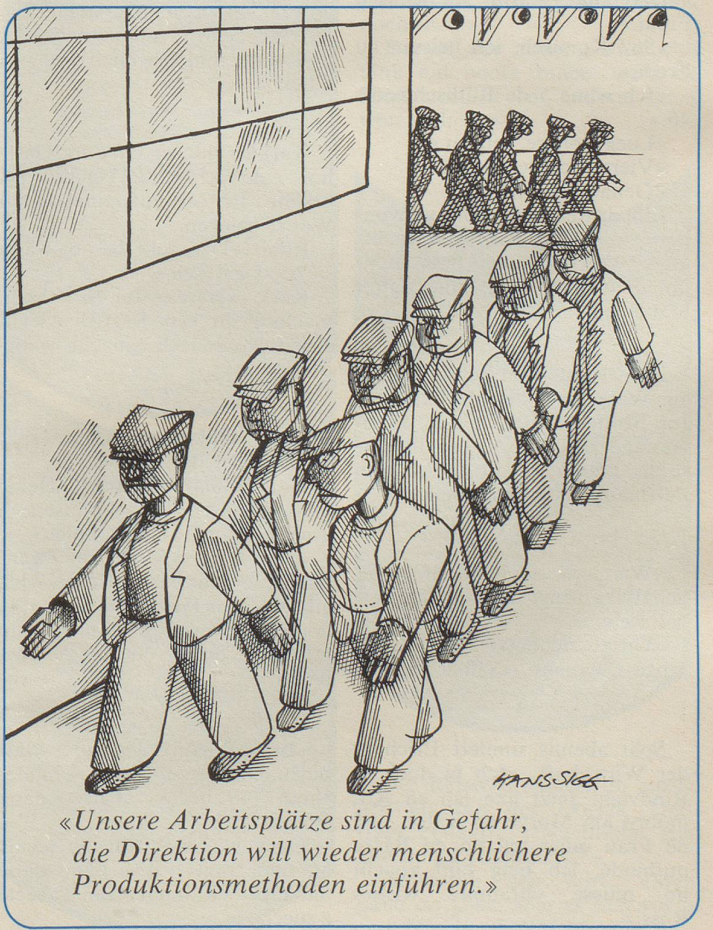
«Unsere Arbeitsplätze sind in Gefahr, die Direktion will wieder menschlichere Produktionsmethoden einführen.»