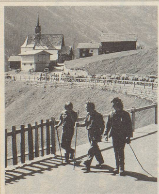
«Region Oberalp, wo Ferien noch Ferien sind!»

Ein Wanderparadies im Herzen der Schweiz wurde gesucht. 4013 richtige Lösungen sind eingelangt worden: