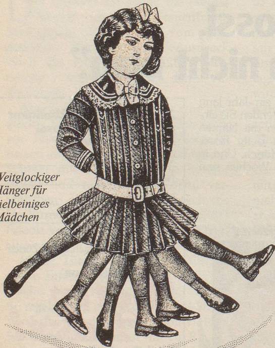
Weitlockiger Hänger für vielbeiniges Mädchen