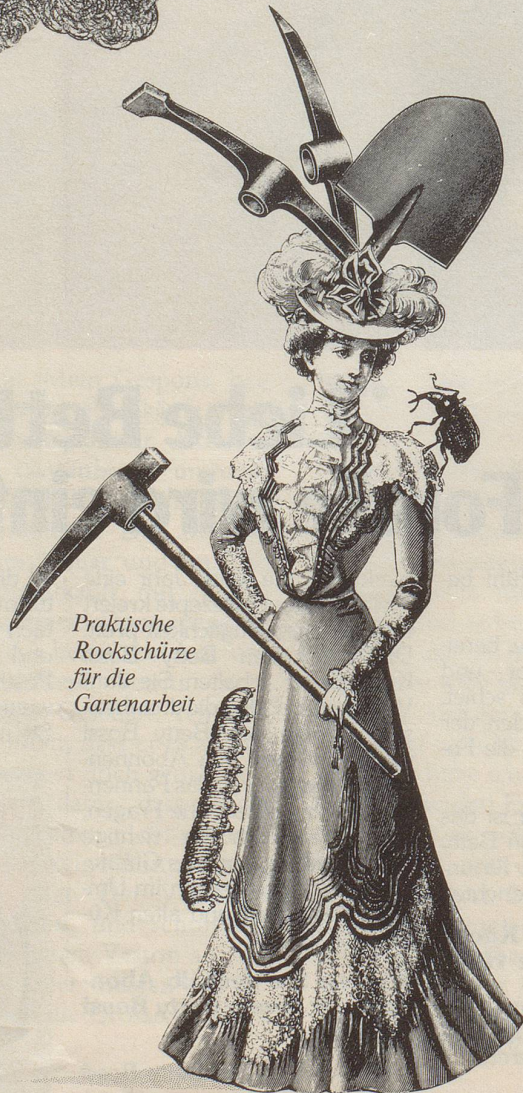
Praktische Rockschürze für die Gartenarbeit