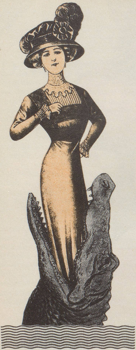
Cocktailkleid für Nilreise