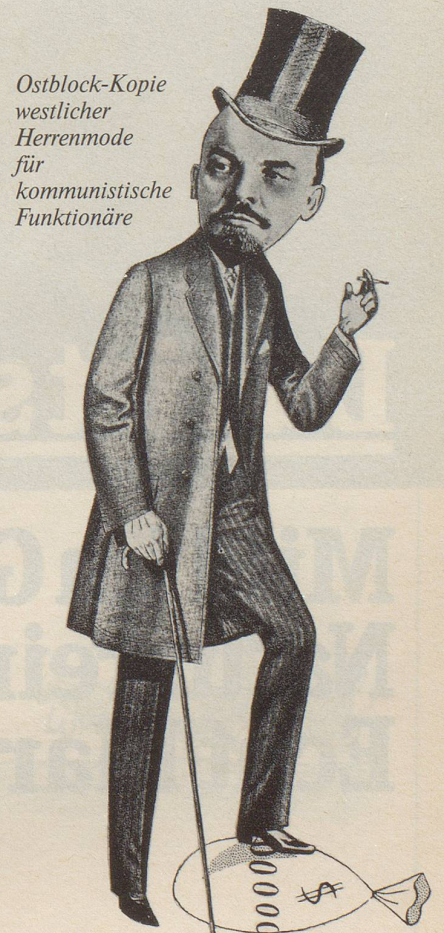
Ostblock-Kopie westlicher Herrenmode für kommunistische Funktionäre