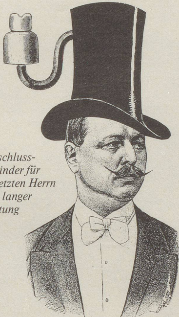
Anschluss- Zylinder für gesetzten Herrn mit langer Leitung