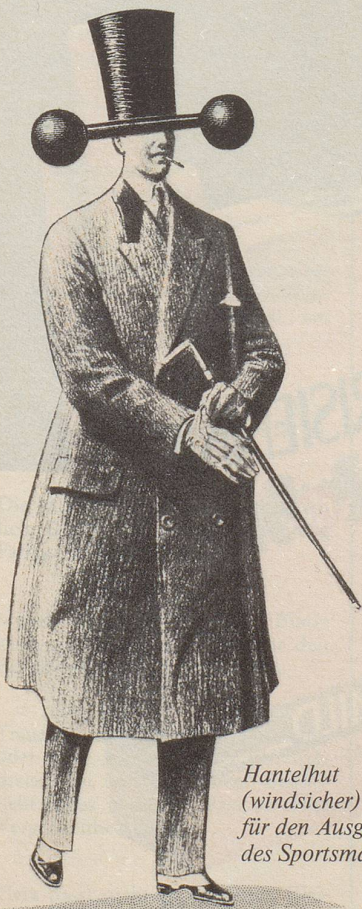
Hantelhut (windsicher) für den Ausgang des Sportsmannes