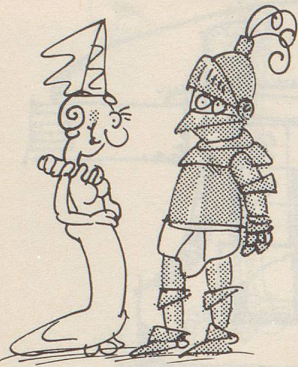
Eisern bleiben und JSA tragen.