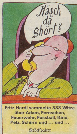
Häsch dä ghört? Fritz Herdi sammelte 333 Witze über Adam, Fernsehen, Feuerwehr, Fussball, Kino, Pelz, Schirm und ... und ... Nebelspalter

Augenfällig an dieser Sammlung – und auch für den Kenner wieder aufs neue überraschend – ist die verblüffende Einheit von Bild und Vers in Bö's Blättern mit jenem einzigartigen Schweizer (Überdialekt) Böscher Prägung, der während vieler Jahre auch charakteristisch für unsere Cabarets wurde. Und so zeigen denn die 140 Blätter dieses Bandes Bö auch als späten Nachfahren jener Moritatenräuber, die auf den Dorf- und Marktplätzen ihre Bilder zeigten und dazu ihre Verse sangen – dem Volk aufs Maul schauend.