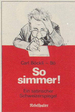
Carl Böckli – Bö So simmer! Ein satirischer Schweizer Spiegel Nebelspalter