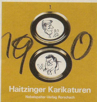
Haitzinger Karikaturen Nebelspalter-Verlag Rorschach